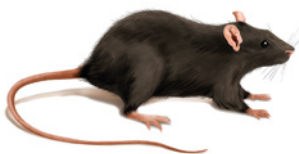
Rata negra o del tejado