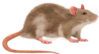
Rata noruega o de alcantarilla